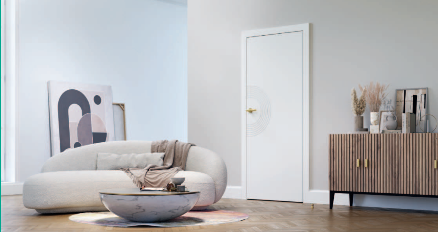
PORTA ART DECO 2, biela, kľučka AZURA zlatá