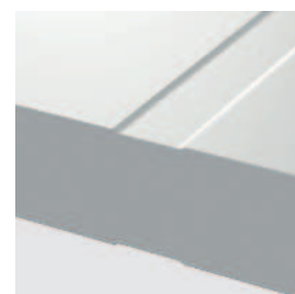
detail frézovania model 2, 3, 4